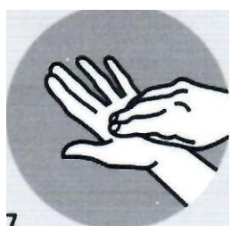
7 Подушечку пальцев