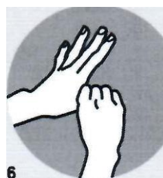
6 Большие пальцы