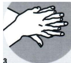
3 Обратную сторону ладоней