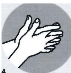
4 Между пальцами